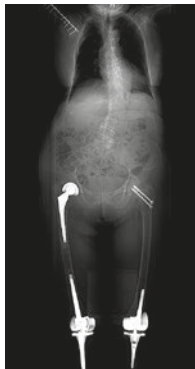
La radiografia mostra l'impianto delle viti SOIB

Nel primo caso è necessaria l'introduzione di due viti mentre negli altri casi di una sola. In linea generale la metodica può essere proposta a tutti i pazienti che hanno subito fratture o che presentano patologie ossee per cui è necessario un supporto meccanico e/o un apporto biologico di sostanze osteoconduttive, osteoinduttive, cementi o farmaci per curare l'osso.