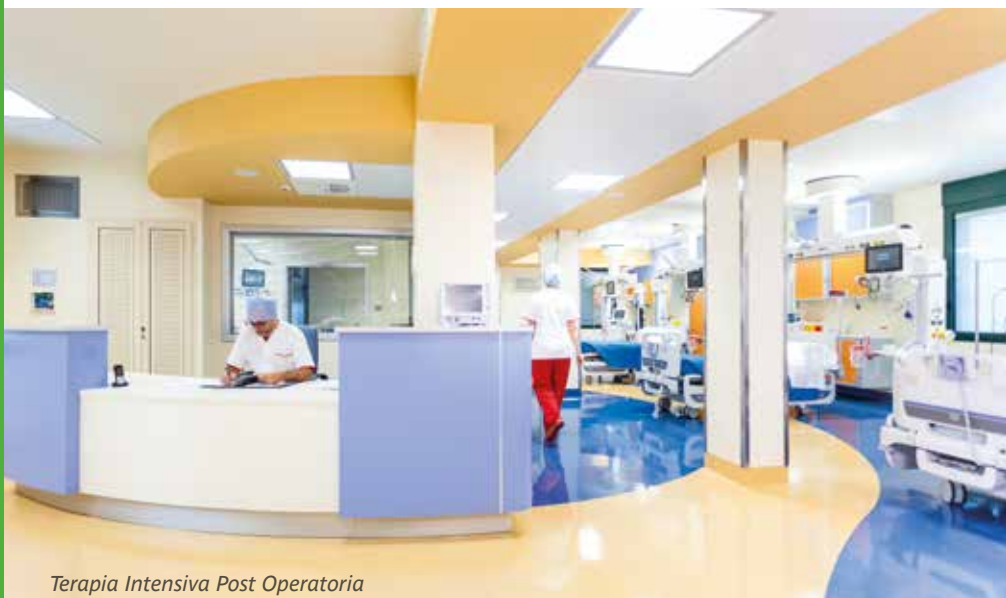
Terapia Intensiva Post Operatoria

I relativi referti vengono allegati alla cartella clinica consentendo all'utente, in caso di interventi chirurgici, di entrare nella struttura il giorno antecedente o il giorno stesso dell'intervento.