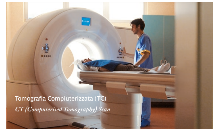
Tomografia Computerizzata (TC) CT (Computerised Tomography) Scan