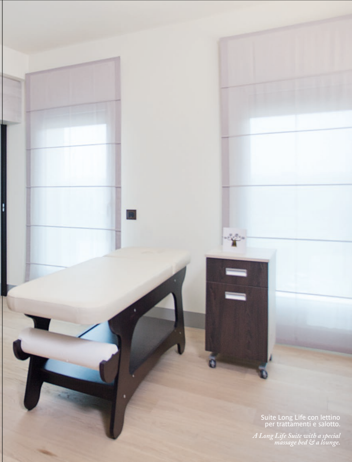
Suite Long Life con lettino per trattamenti e salotto. A Long Life Suite with a special massage bed & a lounge.