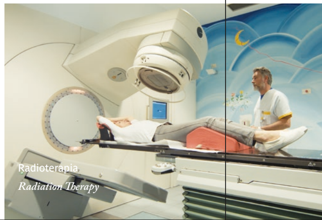
Radioterapia Radiation Therapy