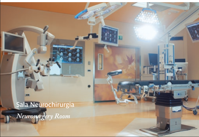
Sala Neurochirurgia Neurosurgery Room

Through the skills of our professionals, advanced technologies and mini-invasive techniques, the hospital stands out in interventional and endovascular cardiology, cardiac surgery, arrhythmology and electrophysiology, neurosurgery, diabetic foot treatment, orthopaedics and traumatology.